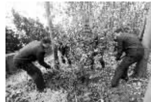
执法人员清理菜地后,种上小树

快报讯(通讯员 高炜 记者 余乐)昨天,现代快报记者从中山陵园管理局获悉,景区内将大量种植大叶苦丁茶、桂花等景观效果良好的绿植。今后,如果再遇到毁林垦荒者,情节严重的处以1000元至1万元罚款。