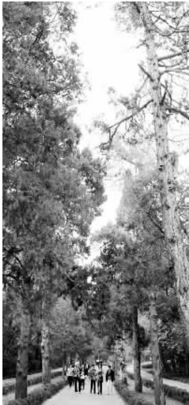
翁仲路上的圆柏也是“绿古董”

昨天,现代快报记者从南京市园林局获悉,全市古树名木认养工作圆满结束,共415株“绿古董”找到监护人。从昨天开始,园林部门为找到新主人的古树挂上认养牌。在这些古树中,“001”号悬铃木(法桐)人气较高,被照顾得很好,但却没有人认养。业内人士透露,为鼓励市民的积极性,今年的认养捐资首次不设底线,但捐资总额也只有几十万元,“远远不够古树名木的复壮救治和设施维护。”