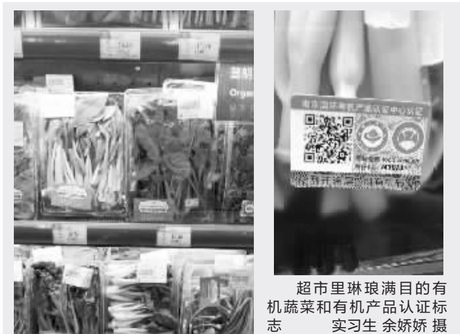
超市里琳琅满目的有机蔬菜和有机产品认证标志