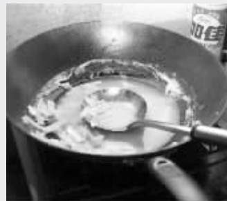
锅里是孩子自己煮的面