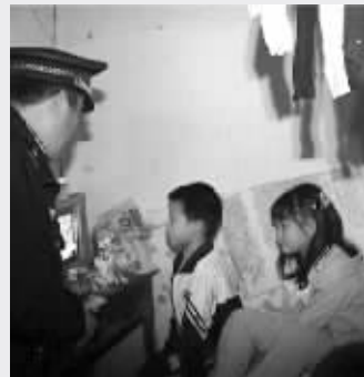
两个孩子在看电视