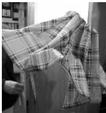
好心姑娘送的紫色方格伞