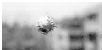
不明枪械击出的弹孔