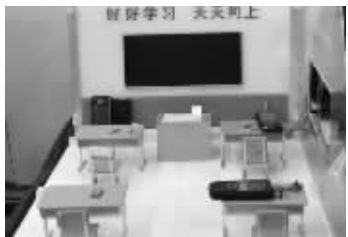
“课堂手机实时监控”模型