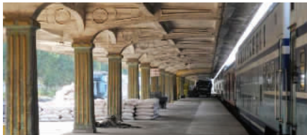
浦口火车站 资料图片

快报讯(记者 刘伟娟)近日,南京市下发《关于科学有序推进区域城市化近期重点工程的意见(2014-2017年)》(征求意见稿),其中提到规划建设铁路南京北站。现代快报记者了解到,铁路南京北站将建在地铁林场站西边。