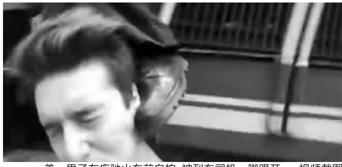
美一男子在疾驰火车前自拍,被列车司机一脚踢开 视频截图