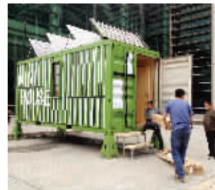
组装“迷你墅”

集装箱内仅15平米空间,但卧室、厨房、卫生间一应俱全。发明团队研究生方珍珍说,从前期设计到实地搭建共花费了3个多月时间。根据市场材料定价,整体费用将控制在18万左右。王玲玲 孙佳桦 姚臻