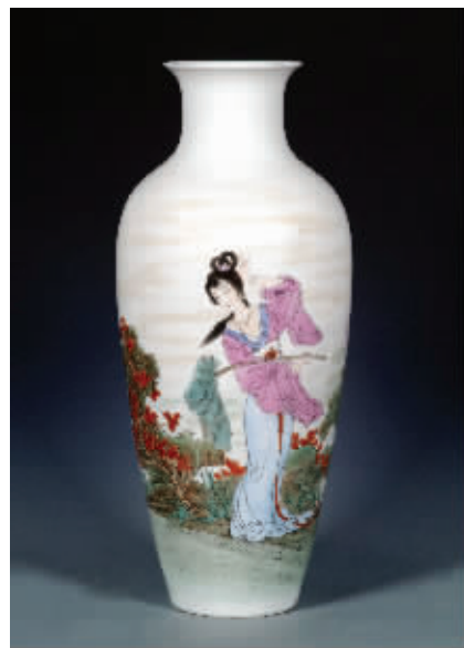
王怀民作品:八仙过海之何仙姑