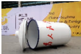
创博会期间,蔡小小将在这巨无霸搪瓷缸里蜗居

昨天,在苏州国际博览中心“创博会”布展现场,来自云南的艺术家蔡小小带来了他的创意“蜗居”——巨无霸搪瓷缸,吸引了不少市民驻足。