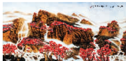
王怀民作品:江山如此多娇