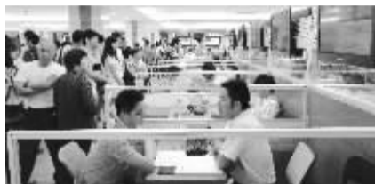
江苏省职业介绍中心举办的招聘会现场