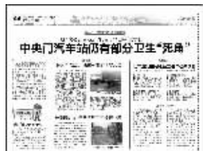
快报相关报道版面截图

据了解,7天内,对涉及15起“脏乱差破”问题,问责了61人。 通讯员 吴德 现代快报记者 鹿伟