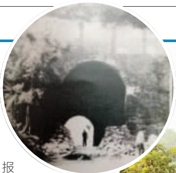
1955年的太平门资料图片

去年年底,现代快报独家报道了南京要重建太平门的消息,昨天,现代快报记者了解到,太平门重建工程已完成了近40%,青奥前将建好三个孔门,保留双向八车道通行,并与修复好的龙脖子段城墙连接。二期还将在城门上建镗楼。不过此前关于龙脖子段城墙和九华山段城墙连为一体的说法,青奥前不会实施。现代快报记者 赵丹丹