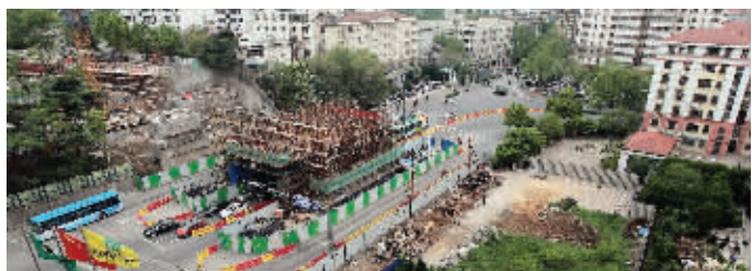
太平门重建现场