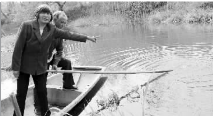
老夫妻描述救人场景