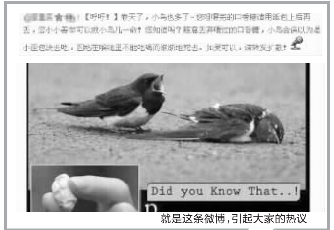
就是这条微博,引起大家的热议

和杀虫剂一样存在危险的还有不少易燃液体,风油精、花露水、打火机、香水、女性化妆品,“特别是一些车载香水,夏天车内温度能达到40℃,被暴晒后很容易发生危险。”