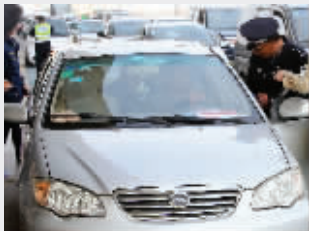
执法人员在询问可疑车辆车主

南京客管处的集中整治行动,已经持续了一段时间,不少黑车驾驶员仍然顶风作案。昨天,三个客管稽查点共查扣8辆非法运营车辆。让人更加担忧的是,现代快报记者跟随稽查人员在南京南站检查时,一辆被查处的黑车上,竟有管制刀具。实际上,这已不是第一次查出管制刀具。 现代快报记者 刘伟伟