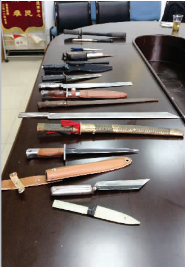
这些刀具、器械,都是此前稽查人员从非法运营车辆上查出来的