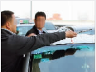
从可疑车辆中发现一把管制刀具