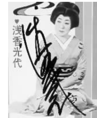
浅香光代年轻时的电影形象

据悉，安倍的外祖父岸信介是日本山口县人，系操纵伪满洲国的五人帮之一，人称“满洲之妖”，是二战甲级战犯。他曾在1957年、1958年两度组阁，担任过3年多的