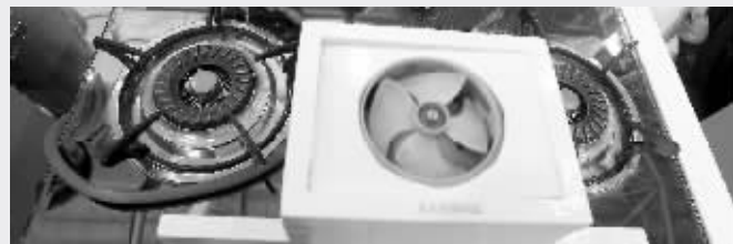
能自动报警的排风扇