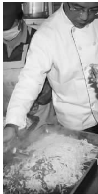
家长代表试菜的温度

家长们,你们进过学校供餐公司的食堂吗?昨日上午,无锡市第一女子中学各年级的26位家长代表,来到该校位于滨湖区的供餐公司,实地考察菜品的制作过程。 徐振