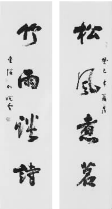
孙晓云对联《松风 竹雨》