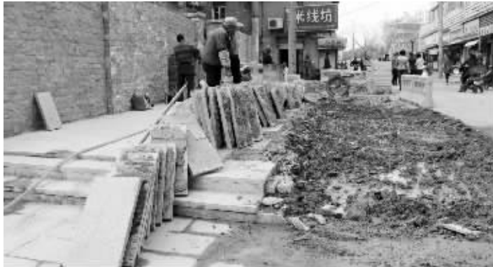
刚铺的大理石砖又被撬了出来

王先生家住迈皋桥街2号楼, 原先, 迈皋桥老街还没有改造的时候, 家门前脏乱差。一年多前, 迈皋桥老街改造, 王先生的家门前, 也留出了一块“久违”的空地。说久违, 是因为长期以来, 这块20多平米的地上盖满了违建门面房。