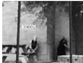
枪击案现场 监控截图

发生枪击事件的美国胡德堡军事基地当地时间2日深夜发布正式消息,称当天下午的枪击事件确认致死包括枪手在内共4人,另有16人受伤。枪手身份得到确认,系一名曾在伊拉克服役的美军士兵。这些天,他因为精神问题正在接受治疗。