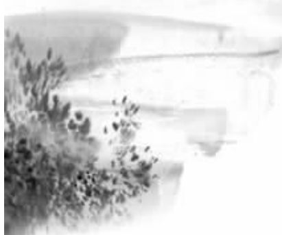
美文诵读音乐会·《聆听清明》 演出时间:2014年4月5日晚 演出地点:南京520音乐厅(长江路101号南京文化艺术中心)