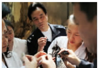
民警将小喜鹊送到附近医院,医护人员小心翼翼地救治小喜鹊