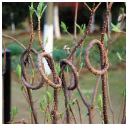
树,能不能说看,你是付出了多大的努力,才当上了奥迪汽车的代言? 摄于幕府西路