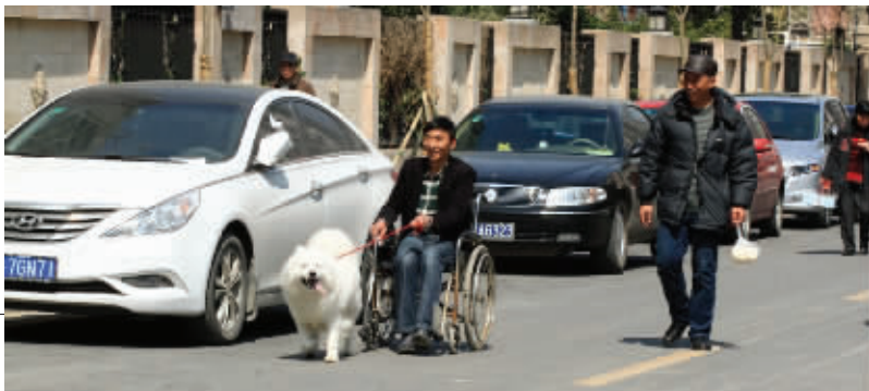
再不讲理的小东西,也会悄悄长大,变成主人的好“马”。“爸比”去哪儿?我带你去! 3月15日摄于尚书巷 (作者 颜英)