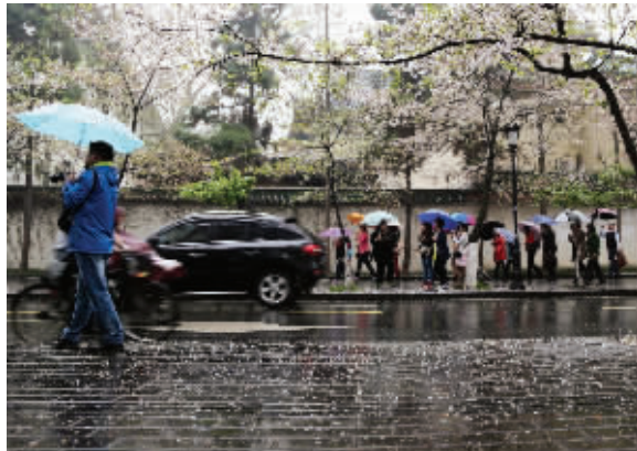
雨中赏樱花,这才叫落英缤纷,别有一番情趣。 3月29日摄于鸡鸣寺 (作者 晓敏)