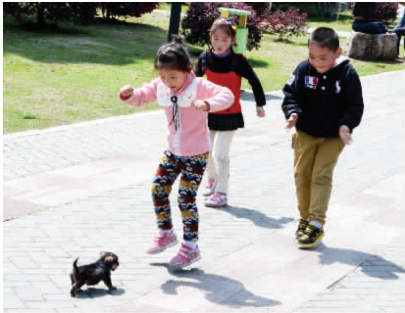
狭路相逢一对三:三个小把戏,遇到一个不讲理的小东西,看谁能横过谁。 3月30日摄于神策门公园