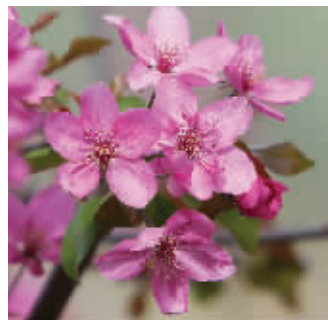
紫花海棠

快报讯(通讯员 李军 记者 刘伟娟)昨天,莫愁湖公园内的紫花海棠盛开了。紫花海棠属于晚花品种,莫愁湖公园内有26种。其中大部分是北美品种,如北美王族海棠,观赏点在海棠精品园。紫花海棠里有个品种最值得一提,那就是紫叶垂丝海棠,这个品种是南京人培育出来的。