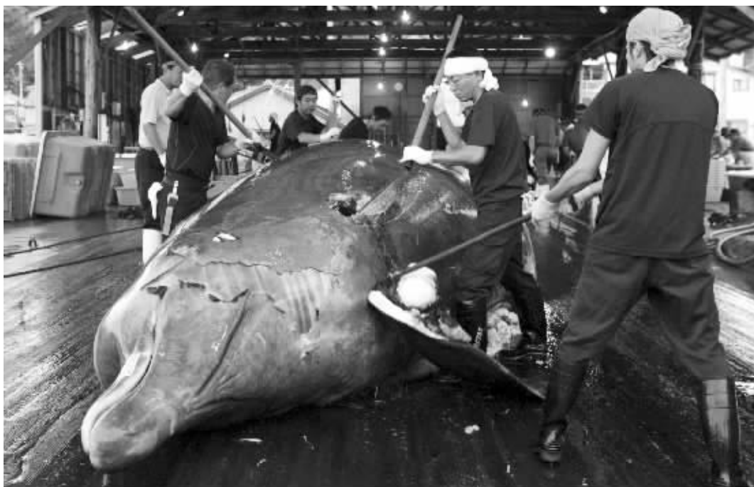
2008年6月28日资料照片:日本工人屠宰鲸鱼

联合国海牙国际法院3月31日就澳大利亚诉日本捕鲸案作出判决,认定日本每年在南极海域捕鲸并非出于“科学研究”目的,要求日本停止这一活动。