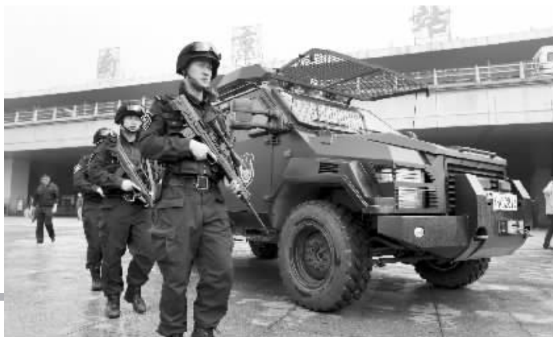
南京在重点区域还配备了装甲车,以应付紧急状况