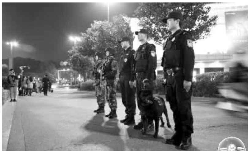
扬州武装巡逻警组一般五人一组,后面两位是武警