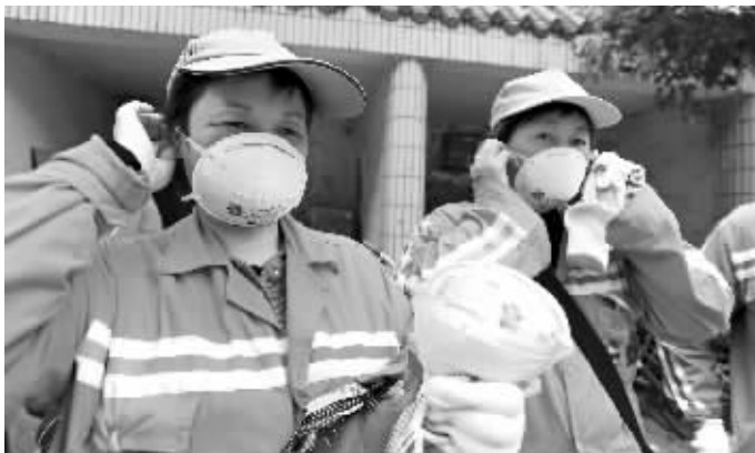
环卫工领到口罩就戴上了 现代快报记者 施向辉 摄

昨天,来自泰然财富资产管理公司南京分公司的志愿者们捐来2000个防雾霾口罩和2000副棉纱防滑手套,和现代快报记者一起送到秦淮区环卫所约800名环卫工手中。 现代快报记者 仲茜