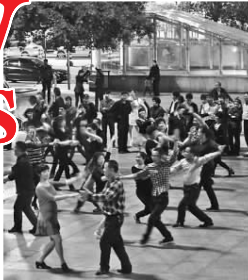
同一天,广场舞依旧热闹