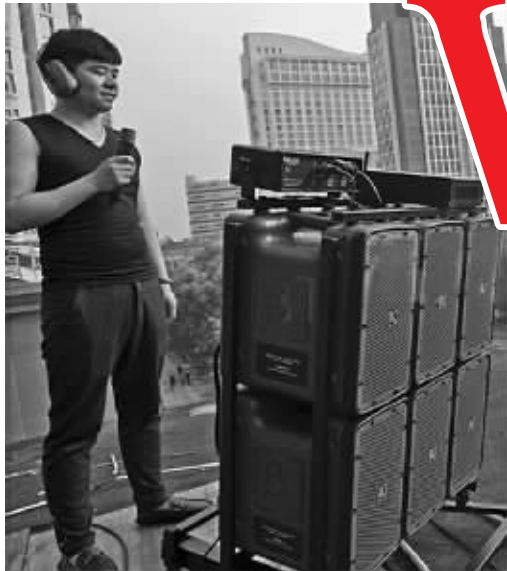
调音师正在调试远程音响

在多次交涉无果后,浙江省温州市区新国光商住广场的住户们下了血本。他们花26万元买来“高音炮”,和广场舞音乐同时播放。住户们说,这也是没办法的办法。