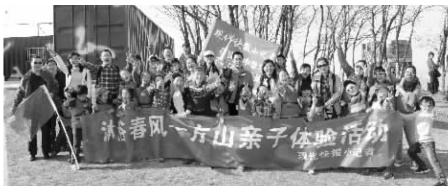
一天的活动,让家长孩子更亲近了