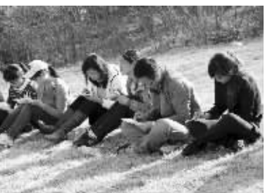
用心写下给孩子的话

现代快报小记者1群: 305241946 微信公众号: xdkbjxjz 咨询电话: 025-84783689 (刘老师)