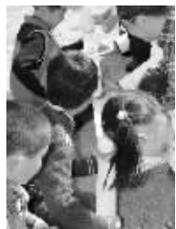
▼游戏眨眼传数字 考验注意力