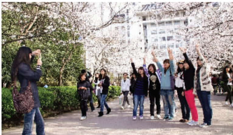
3月,南林的樱花竞相绽放,年轻人在南林科技楼前留下青春的倩影