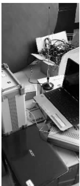
发短信诈骗用的三种主要工具

其他涉案嫌疑人由公安部交福建、广东、贵州、江西、海南以及山东等省区公安机关侦办。