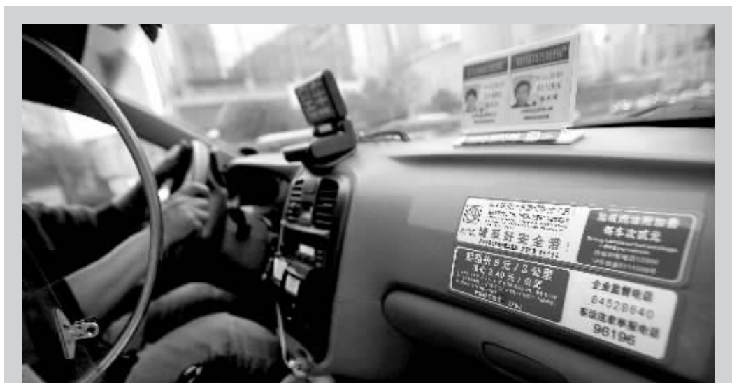
双计费后,出租车副驾驶座位前都会贴上新的价签

时间段: 7:00-9:00 和 16:00-19:00时段内实施“双计费”。 计费方法: 当出租车行驶速度在12公里/小时以下或停驶时,按车公里租价/5分钟计时收费。即:经济型出租车(如桑塔纳等)计时收费标准为2.4元/5分钟;其他车型(中高档出租车及纯电动出租车)计时收费标准均为2.9元/5分钟。 早晚高峰期,如果堵在路上,即使没达到起步里程,也可能超过起步价,时间将折算成里程。以普通出租车为例,每低速行驶或停驶30秒将折算成100米。