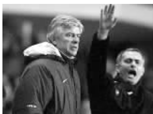
穆里尼奥(右)承认达不到温格的高度

不经意间,65岁的法国儒帅已经陪伴阿森纳走到了第18个年头,这一刻就连温格自己也感到匪夷所思。事实上,他与“枪手”的故事可能到了画上句号的时候。昨天据英国媒体报道,和切尔西的比赛结束后,温格告诉球员们,他可能在今年夏天,也就是本赛季后选择退休,从而离开已经为之服务18年的阿森纳。