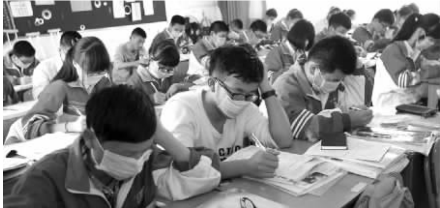
平阳中学高二某班学生们戴着口罩上课,抗议附近企业排出刺鼻的工业废气