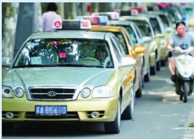
南京出租车实施“双计费”了 微博图片