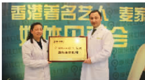
▲2012年凯撒博士首次莅临康贝佳口腔并授予BICON种植体基地奖牌

久负盛名,备受瞩目的凯撒博士堪称是欧洲“最难约见”的牙医,连皇室看牙都得预约。鲜少出国巡诊的凯撒博士选择3月再度来宁,表示这是其世界巡诊中最期待的一站。3月是植牙的最好时机,源于人体新陈代谢加快,使得伤口愈合更快痛苦更小。当然期待在当天获得凯撒博士亲诊的患者队伍也非常庞大,不过凯撒有他的规矩,26日当天只看10位患者,并且必须提前预约。