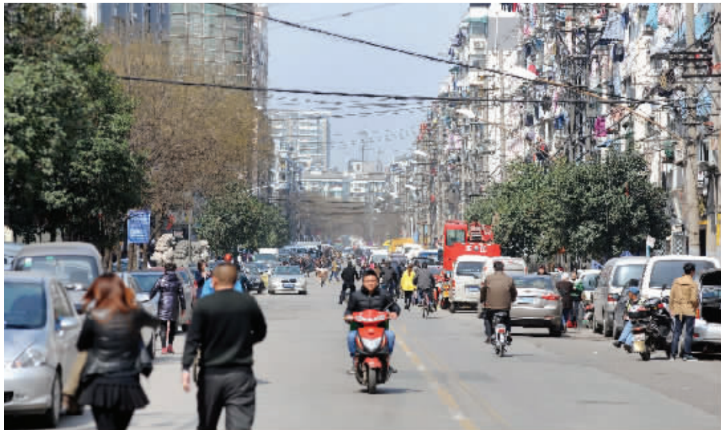
如今的朝天宫西街