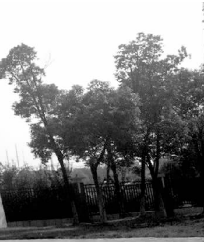
惠生(南京)清洁能源股份有限公司