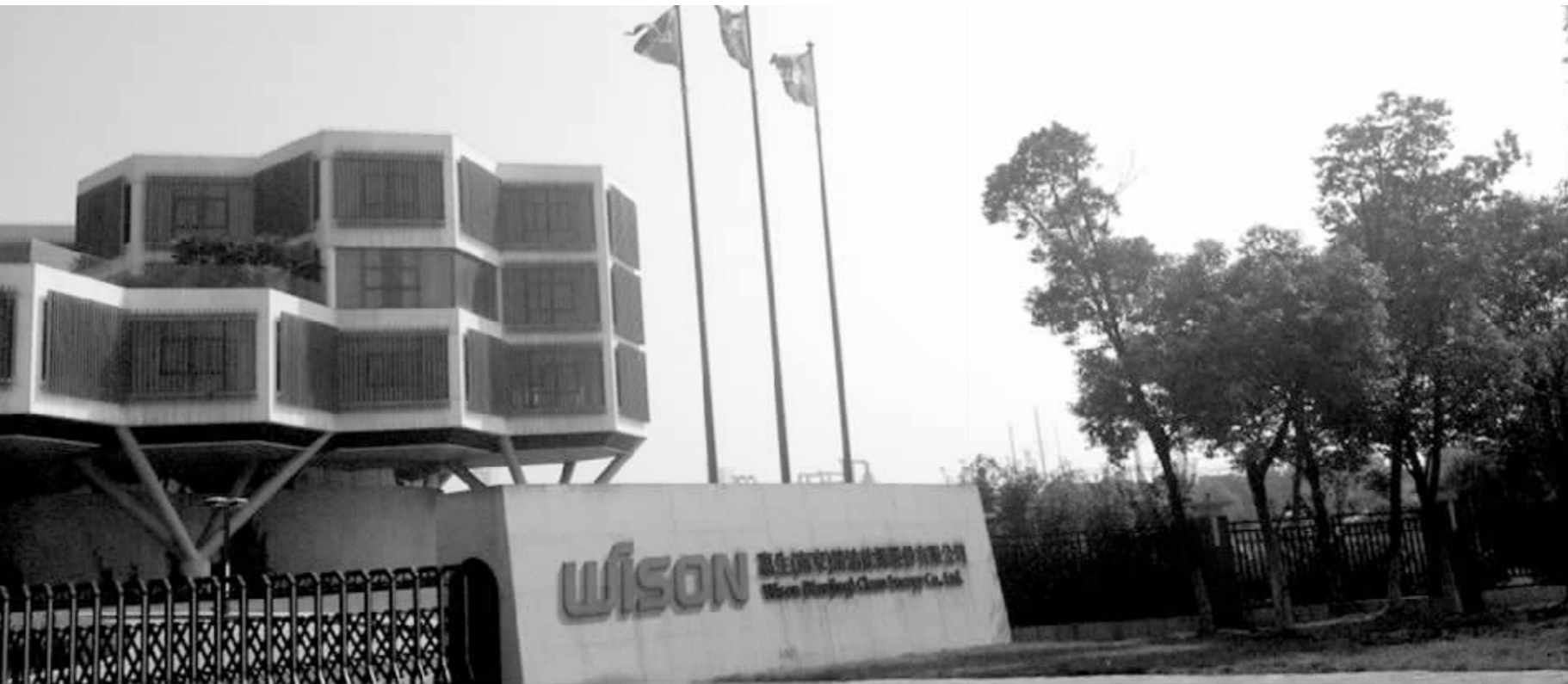
惠生(南京)清洁能源股份有限公司