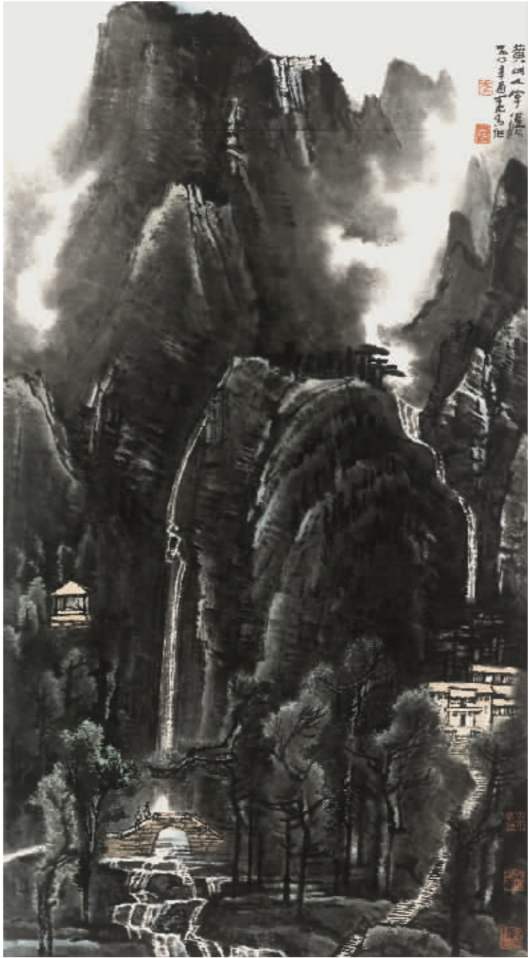
李可染《黄山人字瀑》