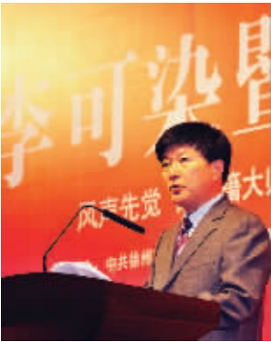
徐州市委书记曹新平在李可染暨“彭城画派”书画作品展上讲话