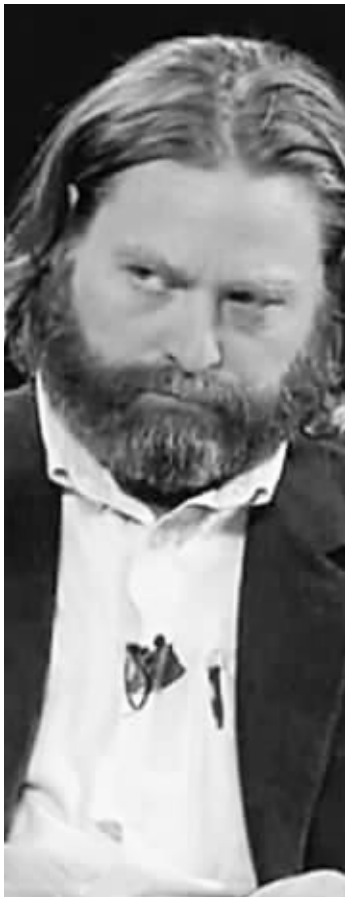
加利凡纳基斯阴沉着脸