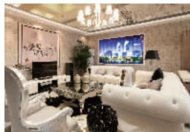
锦华装饰设计效果图

随着生活水平的不断提高,消费者对家居产品的关注已不仅仅停留在产品质量与功能上,而是将更多的目光投向了产品购买和消费过程中的情感与价值体验。因此,体验式消费已经成为顾客消费价值的重要驱动因素,体验式营销一时间成为众商家推崇的新营销模式,家装公司也开始适应潮流推陈出新。 现代快报记者 余益霞