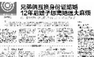
快报2013年11月13日曾作报道