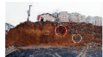
现场古墓只剩一面墓壁(圈中所示)

昨晚,现代快报记者了解到,目前,文物部门已经对施工单位下发了停工通知书,今天,还将对相关人员进行笔录调查。处罚结果,将根据调查结果来定。此事仍在进一步调查中,但相关部门未透露施工方信息。