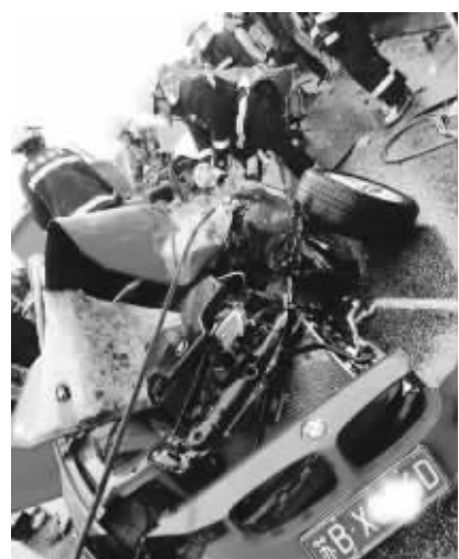
宝马车被撞得面目全非

据江阴市警方相关人员介绍,此次事故,主要造成宝马车司机受伤,被救后很快送到医院急救,事故未造成其他伤害。薛晨