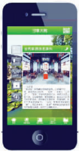
老板自助导航,目前已升级资料图片

据介绍,这款自助导览系统年初已面向部分游客免费试用,近期将正式推出。实习生 徐红艳 现代快报记者 胡玉梅