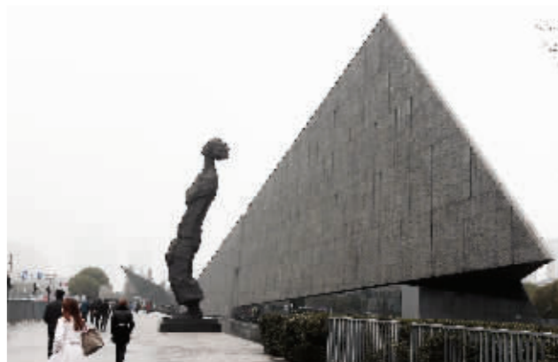
江东门纪念馆门前的雕塑群