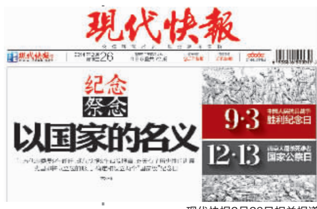
现代快报2月26日相关报道

至于什么时候开工,相关负责人表示,自中国人民抗日战争胜利纪念日、南京大屠杀死难者国家公祭日确定后,新馆等级也高了,目前正在补充完善相应程序,具体开工时间虽没有完全确定,但会很快。