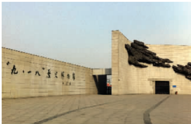
沈阳的“九·一八”历史博物馆