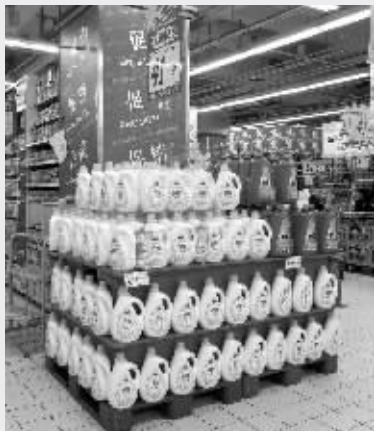
超市的洗化用品货架

抽检结果显示,4个批次的不合格产品中,2个批次洗衣液活性物含量低于标准规定,1个批次洗衣粉和1个批次洗衣液去污力低于标准要求。