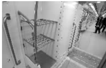
列车车厢内行李架