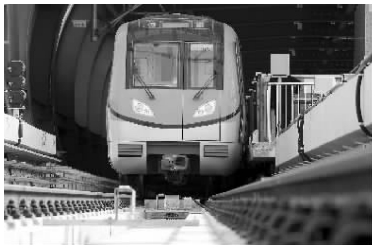
“宝石绿”停在正方中路站

昨天,南京机场线“宝石绿”也开始空载试运行了。这是继10号线“土豪金”后,又一条空载试运行线路。