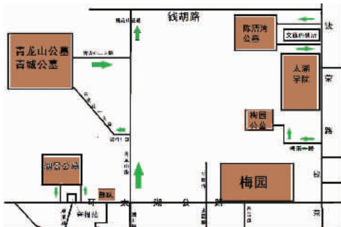
进出各公墓行车路线示意图