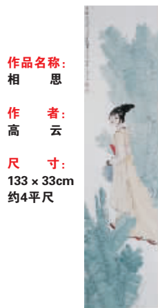
作品名称:相思 作者:高云 尺寸:133 x 33cm 约4平方尺