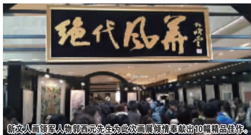
新文人画领军人物郭西元先生为此次画展倾情奉献出10幅精品佳作。

3月8日,由大贺艺术空间主办的“绝代风华”女性主题名家书画精品展于德基广场盛大开幕,此次画展精品纷呈,所选作品均出自名家之手。江苏省书画界三大巨头:省书协主席孙晓云、省美协主席宋玉麟、省中国画学会会长高云及在“你好世界”活动之后享誉海内外的新文人画领军人物郭西元教授等共12位艺术家强强联手,共同为“绝代风华”女性主题名家书画精品展增光添彩。活动现场人头攒动,各界买家竞相询价,热闹非凡。江苏省书法家协会主席孙晓云女士为此次画展提供了近年来的12幅书法精品,包含正草隶篆四种字体,其中尤以两幅团扇作品最受藏家喜爱。