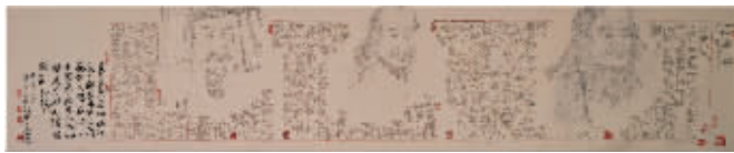
作品名称:人文始祖图 作者:郭西元 尺寸:317 x 64cm 约13.8平方尺