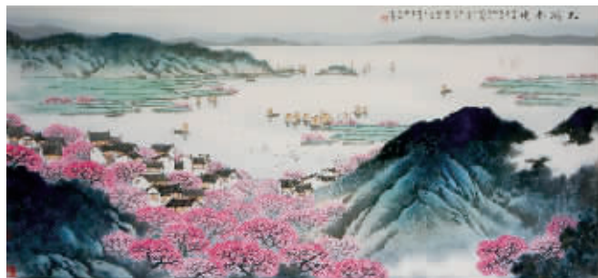
作品名称:太湖春晓 作者:宋玉麟 尺寸:100 x 50cm