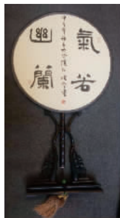
作品名称:气若幽兰 作者:孙晓云 规格:团扇