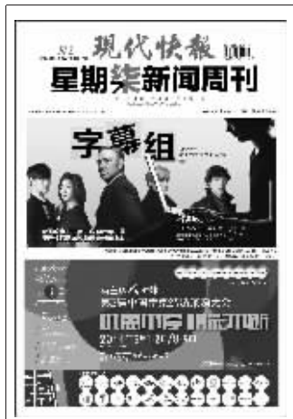
(上星期新闻周刊封面)