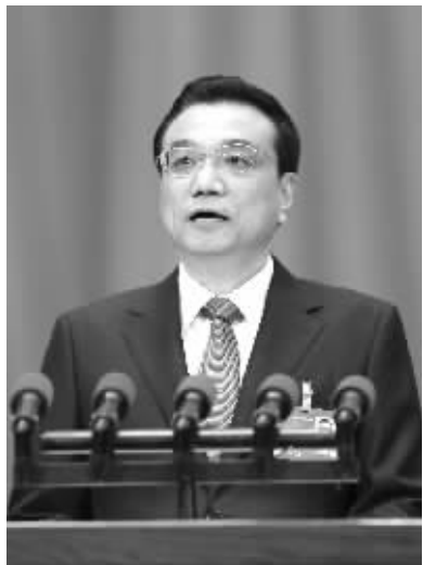
国务院总理李克强

向污染宣战、向雾霾宣战,GDP要走下神坛。GDP不能成为最高的法则,GDP的增长不能意味着对地方政府政绩的当然肯定。挥金如土的生活也不能因拉动内需、增加的税收而洋洋自得。无益的消费在绿色观念下本身是不道德的。向污染宣战,应该是社会生产方式、生活方式、生活态度、观念意识面向生态文明的总体转向。