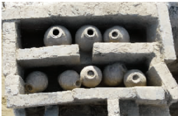
发掘现场出土的韩瓶