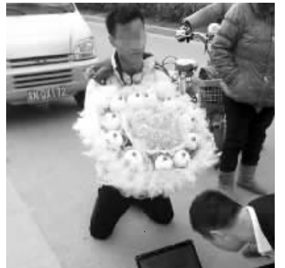
小伙在他女友公司门前下跪道歉

3月3日下午3点半,一位20多岁的小伙一手捧着鲜花,一手抱着笔记本电脑来到了宿迁市宿豫区某科技园门前,不顾周围人诧异的目光,这位小伙子突然“扑通”一声跪了下来。